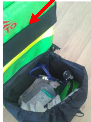
Eszközök összeszedése, a helyszínről való induláskor