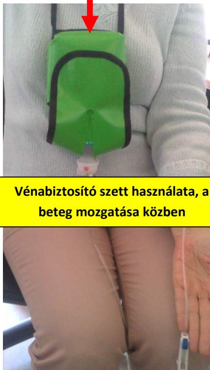
Vénbiztosító szett használata, a beteg mozgatása közben