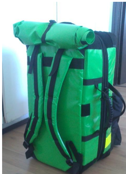
Hátizsák pánt védő fólia levétele vagy felhatjása