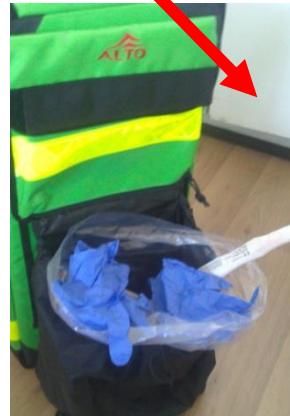
Hulladék összeszedése a helyszínen