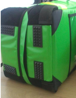
Cipzárt védő fül