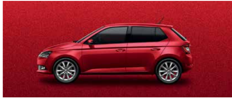
VELVET VÖRÖS METÁL