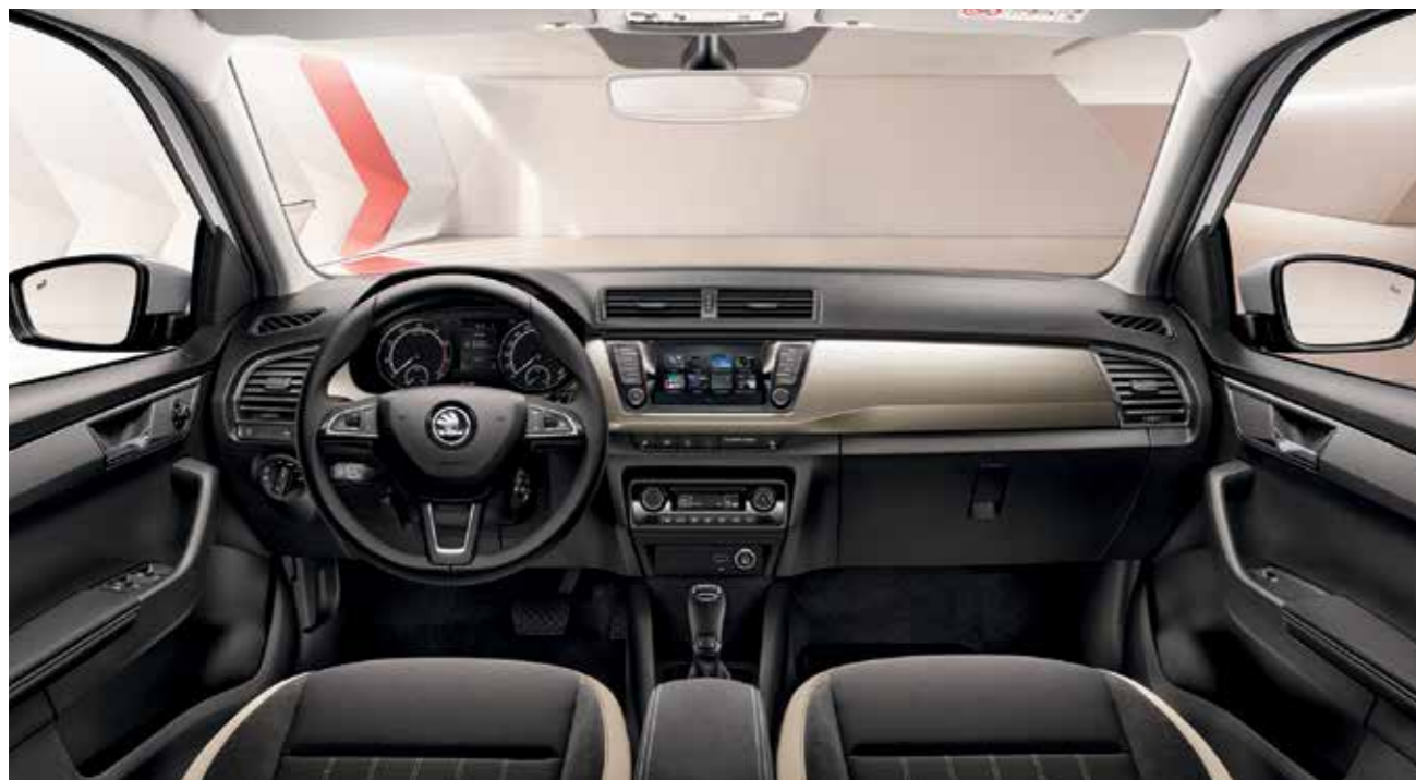
STYLE BÉZS BELSŐ TÉR Zongoralakk fekete dekorbetét Szövetkárpit/Suedia kárpit

A Style változat alapfelszereltsége tartalmazza a sötétedésre aktiválódó fényszórókat, 6 hangszórós ŠKODA Surround rendszert, bőr kormánykereket, első- és hátsó elektromos ablakemelőt, Climatronic klímaberendezést és 6,5"-os színes érintőképernyős Swing rádiót.