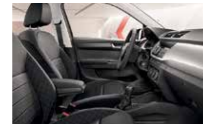
AMBITION KÉK BELSŐ TÉR „Light Brushed” világos dekorbetét Szövetkárpit