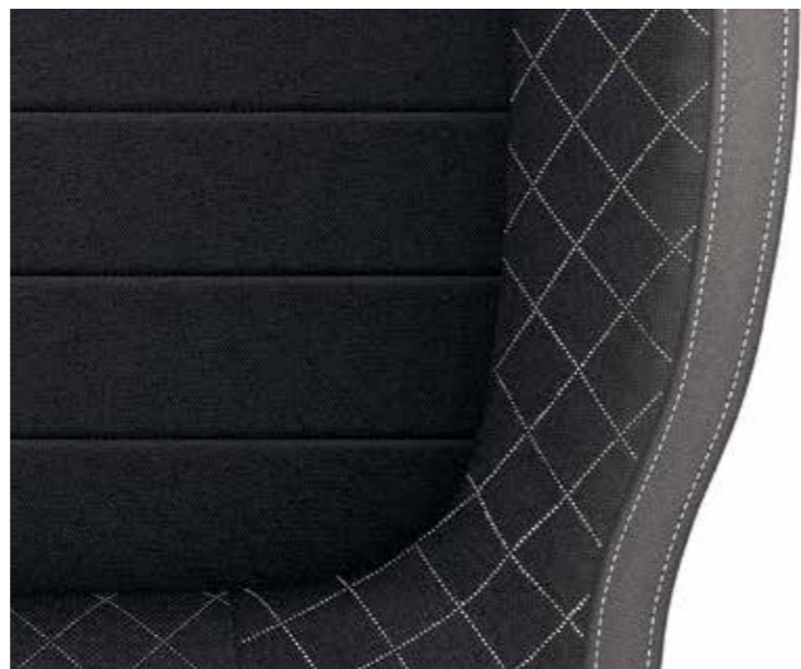
Ambition szürke (szövet)