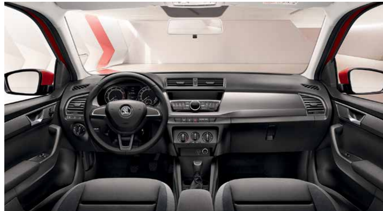
AMBITION KÉK BELSŐ TÉR „Light Brushed” világos dekorbetét Szövetkárpit

Az Ambition változat alapfelszereltsége tartalmazza a Maxi-DOT multifunkciós kijelzőt, Light Brushed világos dekorbetétet, Front Assist és Start-Stop rendszert továbbá Climatic klímaberendezést.