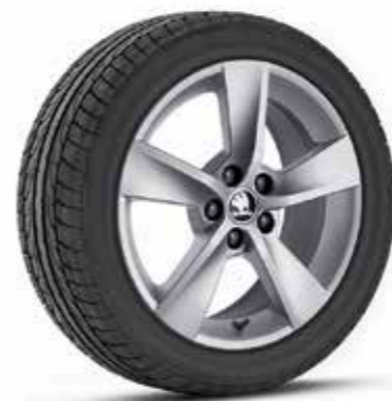
16" ALORE könnyűfém keréktárcsák