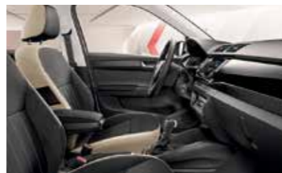
STYLE BÉZS BELSŐ TÉR Zongoralakk fekete dekorbetét Szövetkárpit/Suedia kárpit