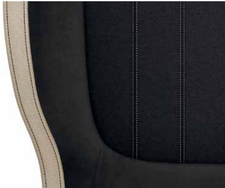
Style fekete (szövet/Suedia)