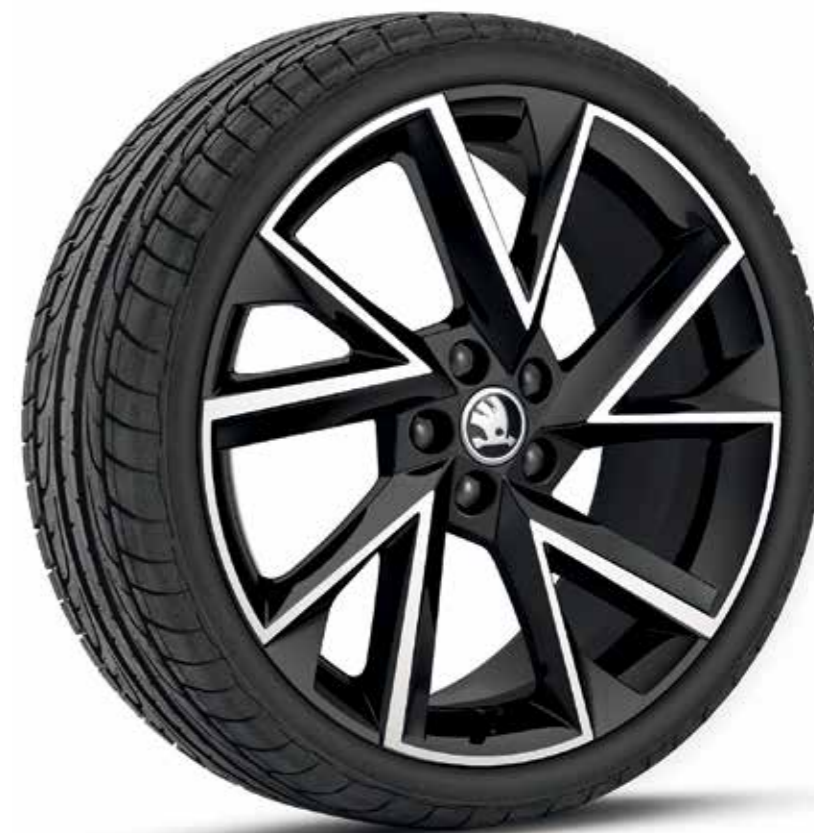
18" VEGA fekete könnyűfém keréktárcsák