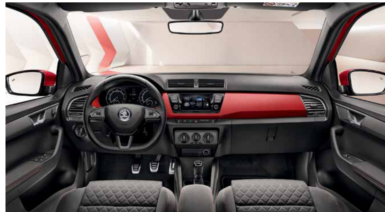
DYNAMIC FEKETE BELSŐ TÉR „Cherry Red” dekorbetét Szövetkárpit/Suedia kárpit

A speciális formatervű, exkluzív fekete sportülések, multifunkciós bőr sportkormány, vörös varrással ellátott ajtókárpit, fekete tetőkárpit, alumínium pedálszett és a sportfutómű kiemeli autója dinamikus karakterét. A Dynamic csomag az Ambition és Style változat extra felszereltségeként érhető el.