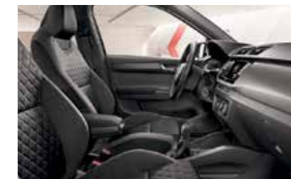
DYNAMIC FEKETE BELSŐ TÉR „Cherry Red” dekorbetét Szövetkárpit/Suedia kárpit