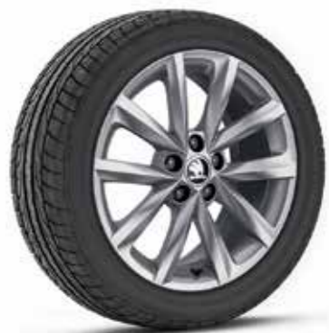
16" VIGO ezüst könnyűfém keréktárcsák