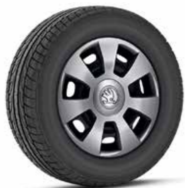
14" FLAIR díztárcsák