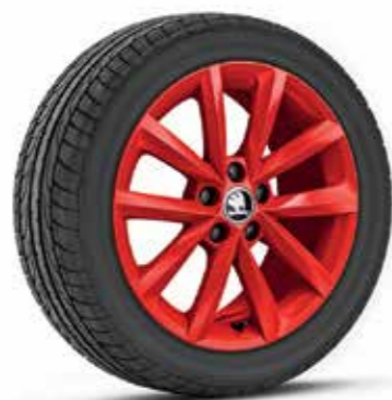
16" VIGO piros könnyűfém keréktárcsák