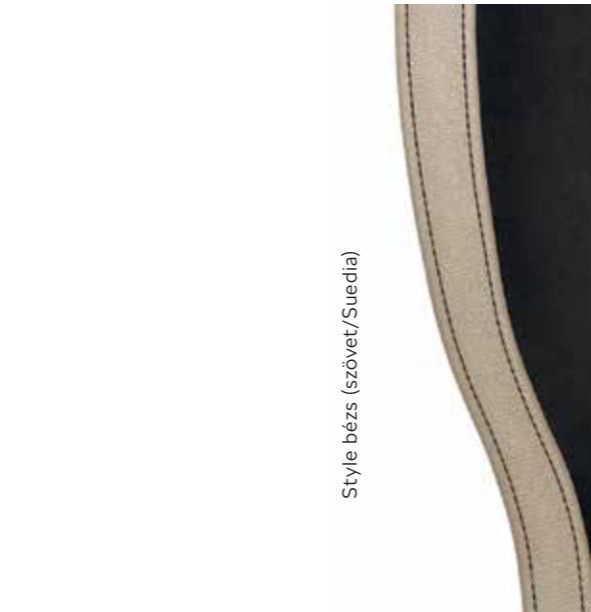
Style bézs (szövet/Suedia)