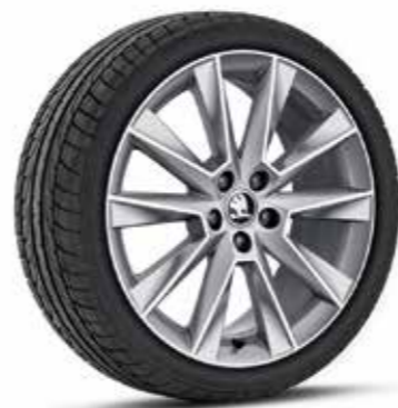
17" SAVIO könnyűfém keréktárcsák