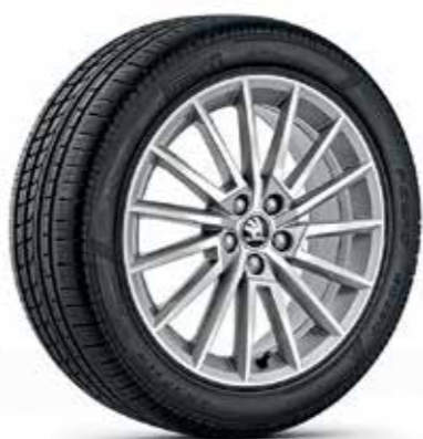
17" TORINO fényes ezüst könnyűfém keréktárcsák