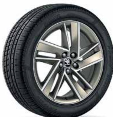
17" BLADE matt platina könnyűfém keréktárcsák, szálcsiszolt