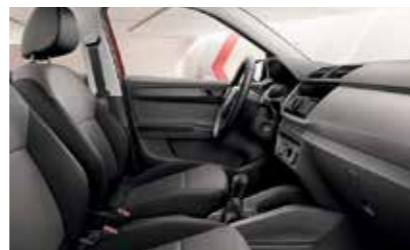
ACTIVE FEKETE BELSŐ TÉR „Basket Narbe Grey” szürke dekorbetét Szövetkárpit