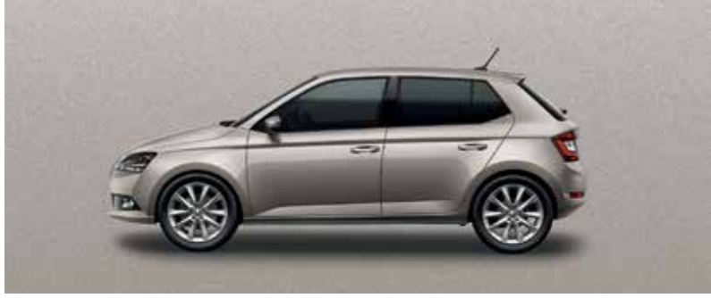
CAPPUCINO BÉZS METÁL