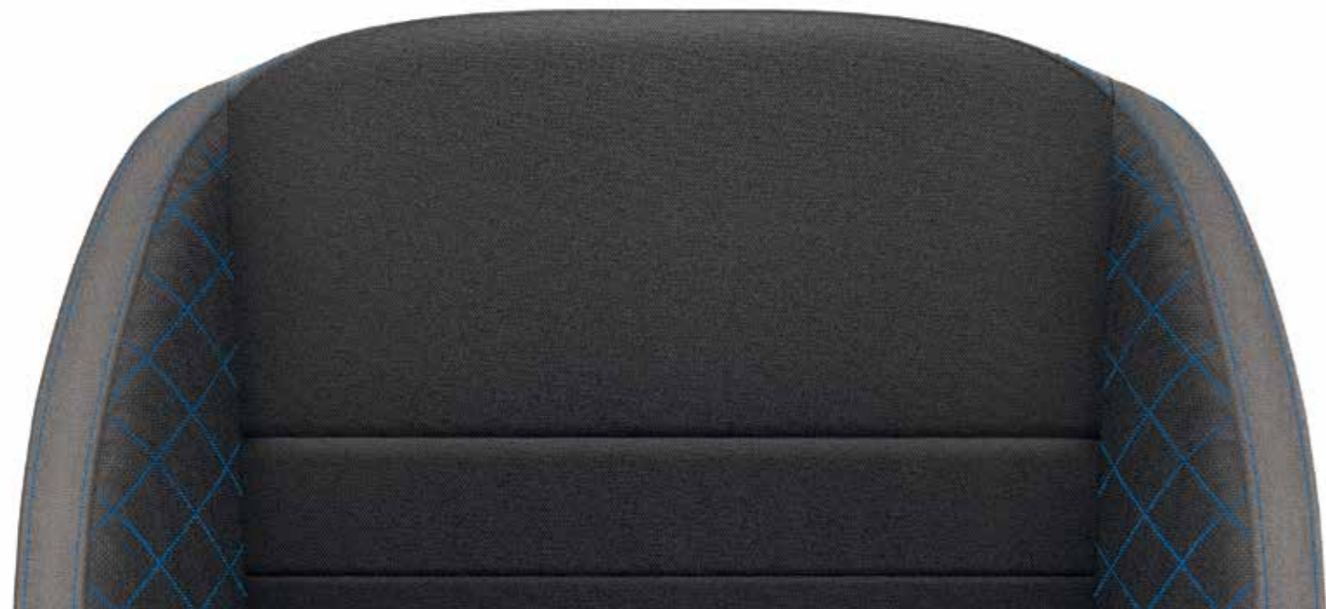
Ambition kék (szövet)