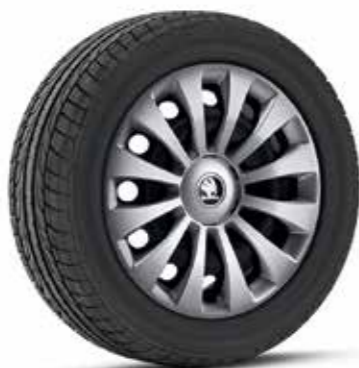
15" COSTA díztárcsák