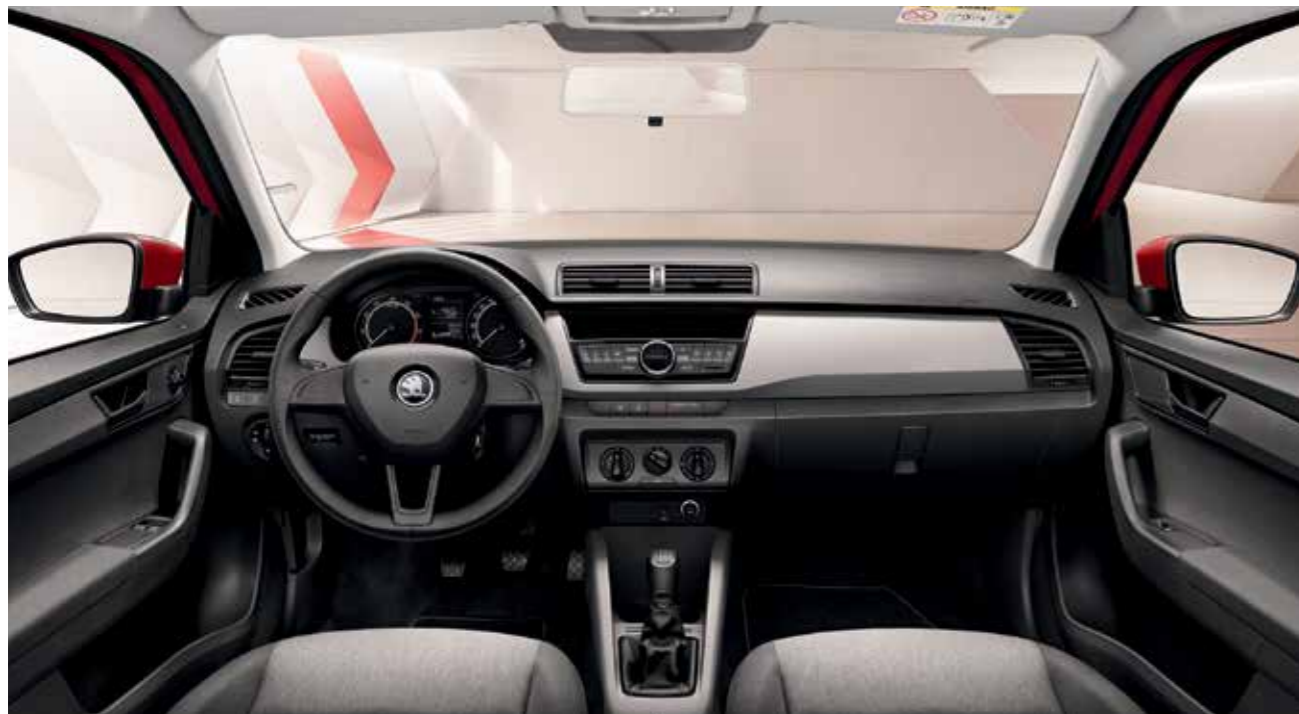
ACTIVE FEKETE BELSŐ TÉR „Basket Narbe Grey” szürke dekorbetét Szövetkárpit

Az Active változat alapfelszereltsége tartalmazza az első króm hűtőrács-keretet, az elektromosan állítható és fűthető oldalsó visszapillantó tükröket, függönylégzsákot, LED nappali menetfényt, 12 V-os csatlakozó aljzatot az utastéren, ESC (elektronikus stabilitásvezérlést) és központi zárat.