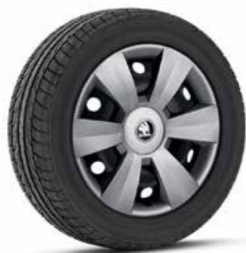
15" DENTRO díztárcsák