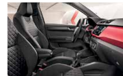
DYNAMIC FEKETE BELSŐ TÉR „Cherry Red” dekorbetét Szövetkárpit/Suedia kárpit