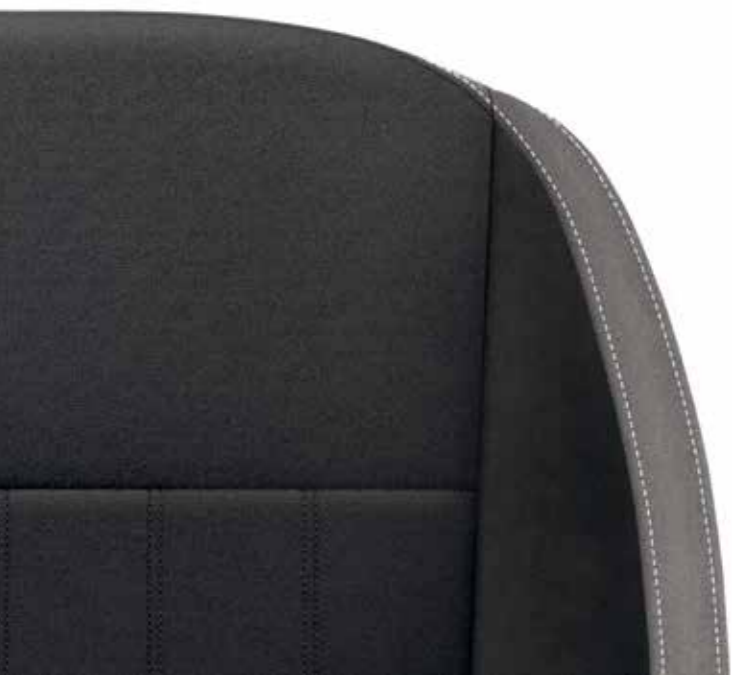
Style fekete (szövet/Suedia)