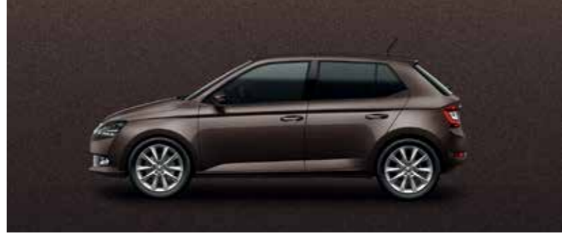
JUHAR BARNÁ METÁL