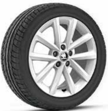
16" VIGO fehér könnyűfém keréktárcsák