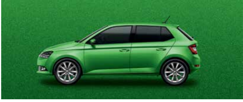
RALLY ZÖLD METÁL