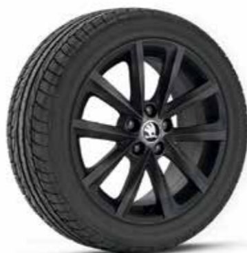
16" VIGO fekete könnyűfém keréktárcsák