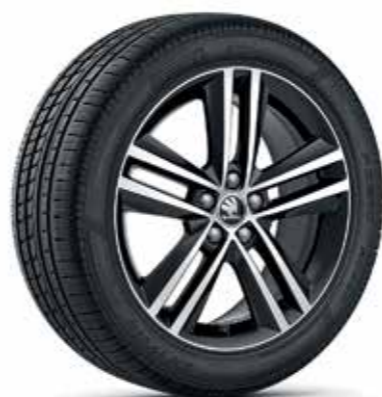
17" RAY fekete metálfényes könnyűfém keréktárcsák, szálcsiszolt