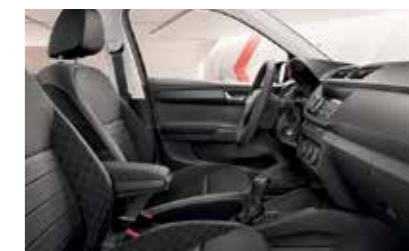
AMBITION SZÜRKE BELSŐ TÉR „Basket Narbe Black” fekete dekorbetét Szövetkárpit